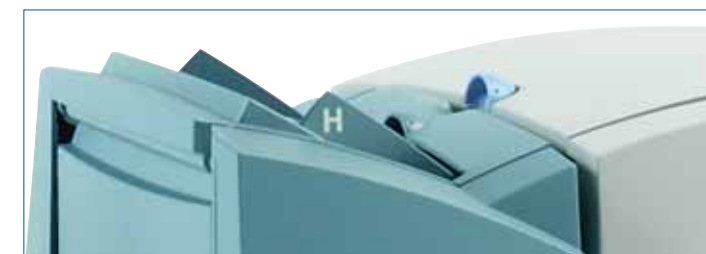
Bandeja de alimentación manual

El acumulador de plegado previo ofrece la opción de procesar sobres de varias páginas, de modo que los documentos pueden plegarse juntos o por separado, según corresponda a la aplicación